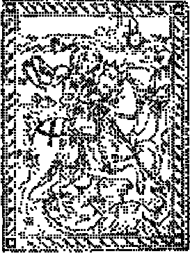
La rappresentazione di santo Giorgio

Stampato in Firenze appresso Giovanni Baleni l'anno 1585.