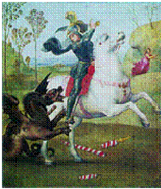
Raffaello, San Giorgio combatte il drago (1504/5), Parigi, Louvre