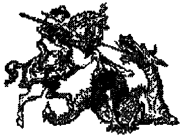
Disegno di Baden-Powell, in Scoutismo per ragazzi, Nuova Fiordaliso, Roma, p.39