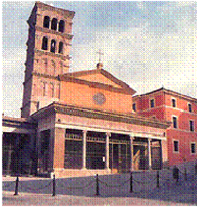
La chiesa di san Giorgio in Velabro