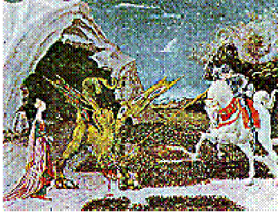
Paolo Uccello, San Giorgio lotta contro il drago (1435), Londra, National Gallery